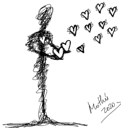
Garabato 12: Mi corazón en tus manos 2 (Mothú 2020)

Queremos resaltar la labor de todas las personas que durante estos días están sosteniendo nuestra sociedad y lo importante que está siendo el encontrarnos los/as unos/as a los/as otros/as en nuestros balcones y ventanas al finalizar el día como un recordatorio de que no estamos solos/as y como muestra de agradecimiento a los que están dándolo todo para superar esta crisis. Lo hacemos a través de este escrito.