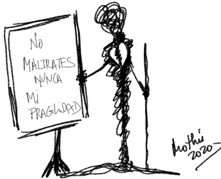
Garabato 5: No maltrates nunca mi fragilidad (Mothú 2020)

A veces somos nosotros los que no podemos hablar con la persona en duelo o tenemos miedo a hacerle daño y/o nos cuesta sostener su dolor. Cuando seas capaz de hablar con la persona, practica una escucha activa y empática , facilita su desahogo, dejándole expresar cómo se siente y las cosas que echa de menos de su familiar. Evita usar frases hechas , que lo único que hacen es minimizar el dolor.