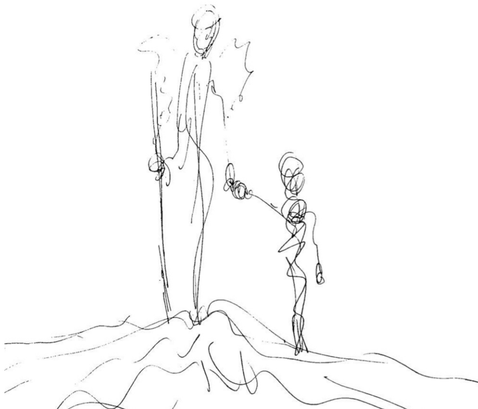
Garabato 1: Siempre contigo (Mothú 2019)

(Pautas elaboradas por profesionales especialistas en duelo y pérdidas)