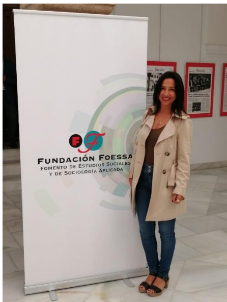
Presentación del estudio de la situación de la pobreza en España en la Asamblea de Extremadura