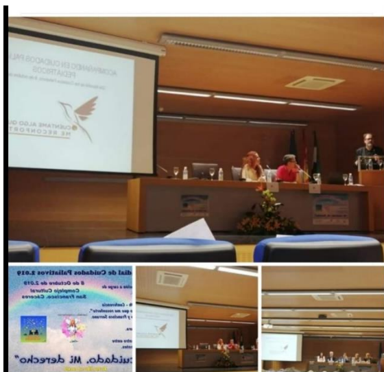
Asistencia a conferencia ofrecida por Apalex en Cáceres